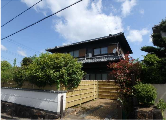
( 外 観 )