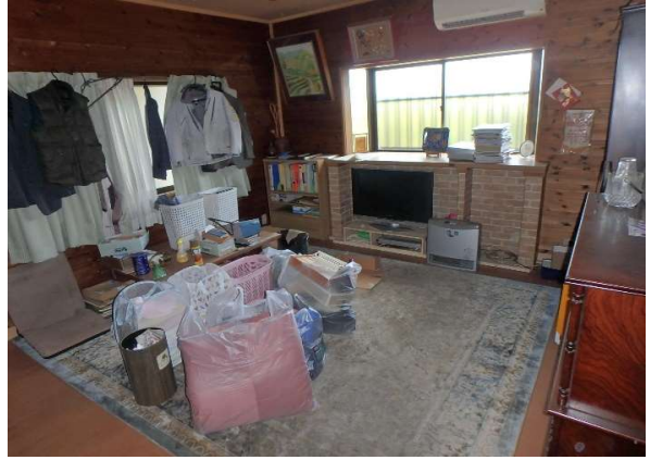
( 1階 洋室 )