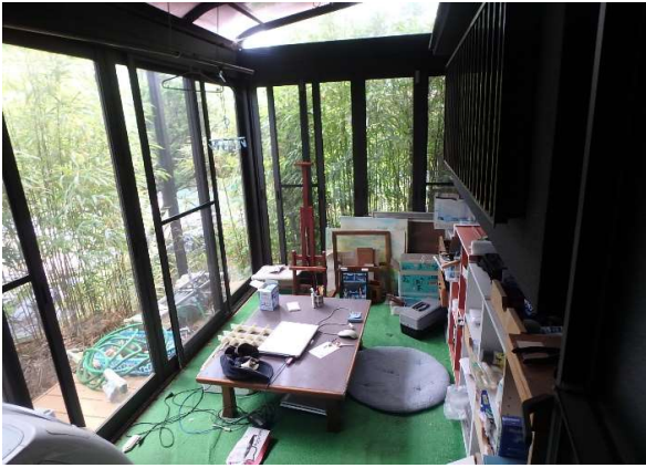
( サンルーム )