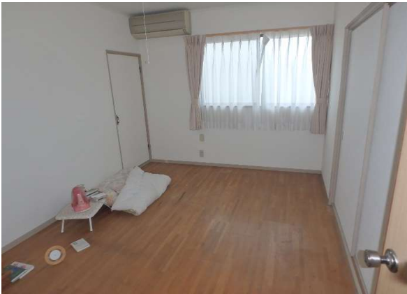
( 2階 洋室① )