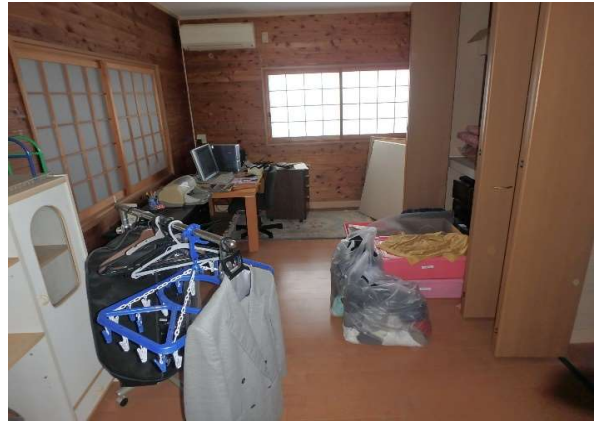
( 2階 和室 )