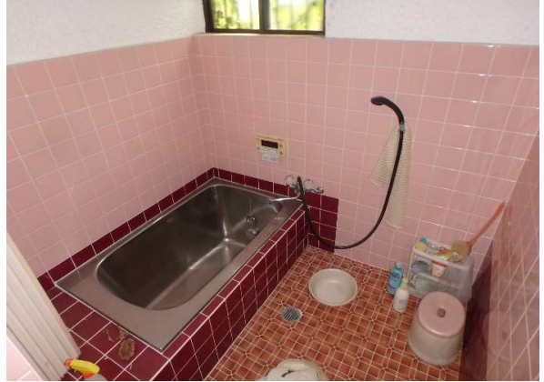
( お 風 呂 )