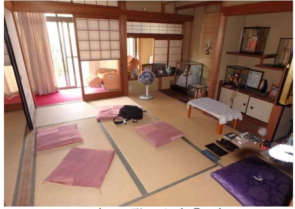
( 1階 和室① )