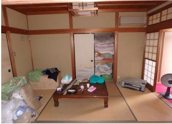
( 1階 和室② )