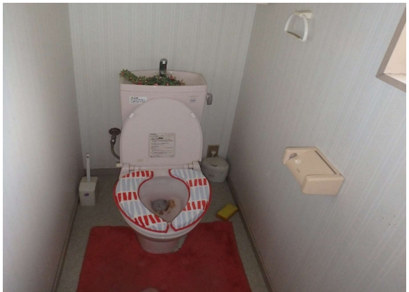
( ト イ レ )