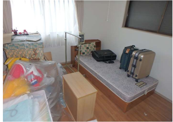
( 2階 洋室② )