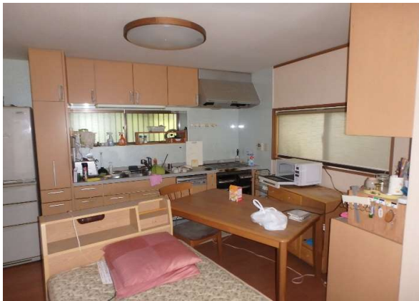
( ダイニングキッチン )