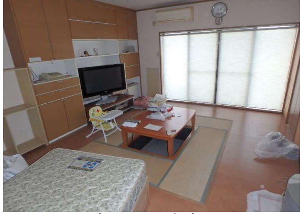
( リビング )