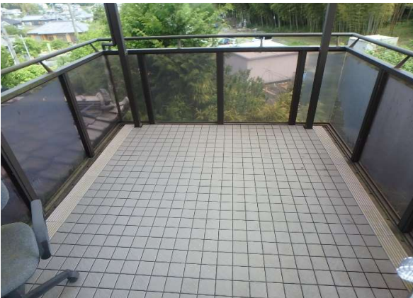
( バルコニー )